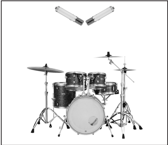
In this diagram, two WA-251's are used in a coincident pair, also known as XY configuration, to record stereo drum overheads.