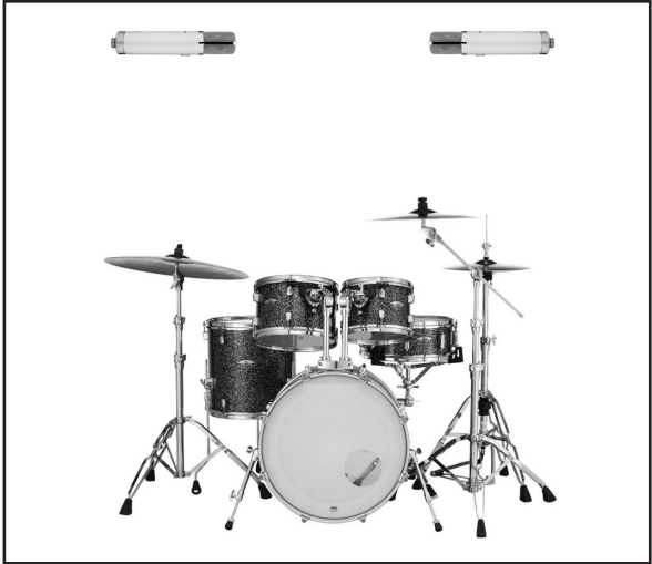
In this diagram, two WA-251's are used in a spaced pair configuration to record stereo drum overheads.